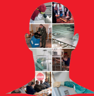
A clean room arises from the mind

Die nominierten Beiträge werden von den Finalisten in einem 10 bis 15 minütigen Vortrag auf der CLEANZONE präsentiert. Darüber hinaus stehen den Nominierten zur Präsentation Ihrer Innovation ein Monitor sowie ein Poster zur Verfügung. Die endgültige Wahl des Gewinners des CLEANROOM AWARD 2014 erfolgt durch die Messebesucher. Der Preis ist mit 3.000 Euro dotiert inklusive einer Presseveröffentlichung im CLEANROOM. MAGAZIN und der GIT ReinraumTechnik.